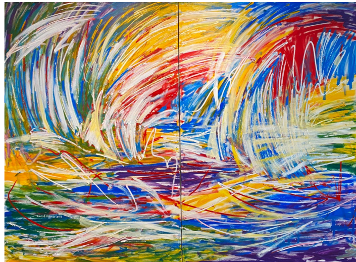
◀ Authentic-V, 《真我-V》 2012 — Acrylic on canvas 183cm x 244cm RM28,800