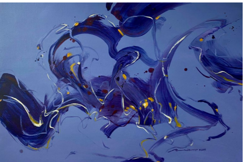
◀ Movement-I, 《动-I》 2024 — Acrylic on canvas 60cm x 90cm RM3,600

在这幅作品中，我再一次探索行动绘画（action painting）的本质，每一笔每一动都源于我当下的直觉。当时，我和同行画家探讨了人类与数字（AI）艺术创作的关系，受到启发，我便创造了一系列名为《动》的作品。我相信，作为人类艺术家，我可以为作品注入一种独特的动感。你可以在流畅的线条和充满活力的笔触中感受到我手中的温度，每一笔都带着人类的触感。