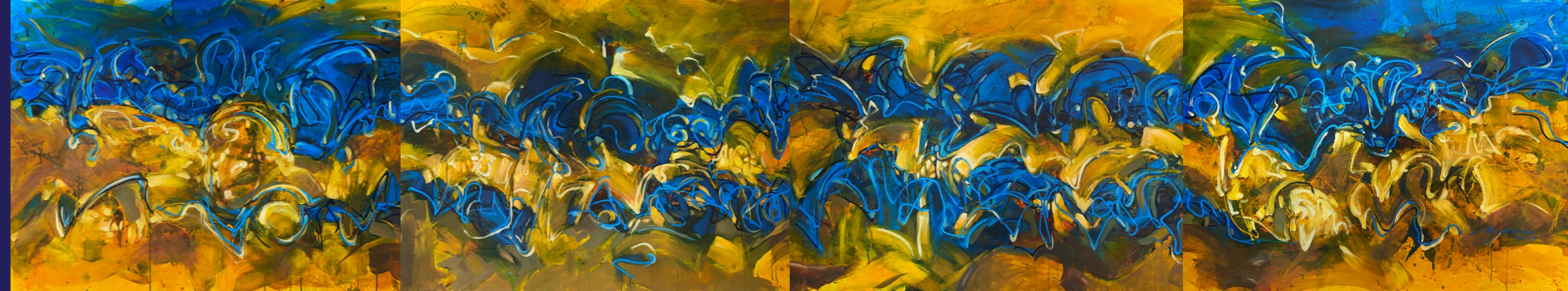
▲ Wheatfield with Hopes, 《希望的麦田》 2023

用抽象来表达和理解抽象表达都是一场场心与心的对话。而人与人旨趣、经历、境遇各异，我们可以说这种差异造就了对话障碍，也可以说它成就了多样化的自由表达。我们希望这次展览可以链接不同的思想，引发不一样的心灵碰撞。