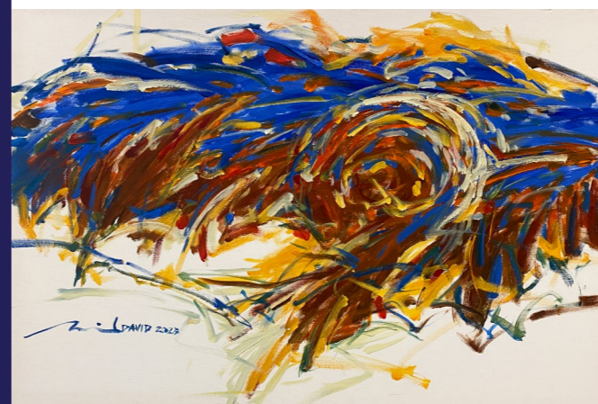
◀ Change, 《变》 2023

这幅画作灵感源自梵高的《有乌鸦的麦田》。原作一方面传递着哀伤和孤独的讯号，一方面想要呈现让他精神振奋的乡间景象。在我的画面中，我保留了金黄色的麦田，没有了乌鸦的阴影和密布的乌云，只有阳光和广阔的天地。这不仅是一幅画，更是我的心灵寄托。它提醒我，无论经历怎样的风雨，阳光总会驱散乌云，希望总会在心中生根发芽。